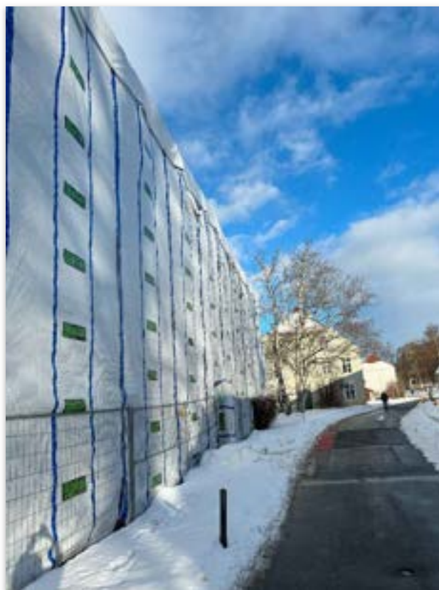
Kriminalasylet var under presenning det meste av 2023.