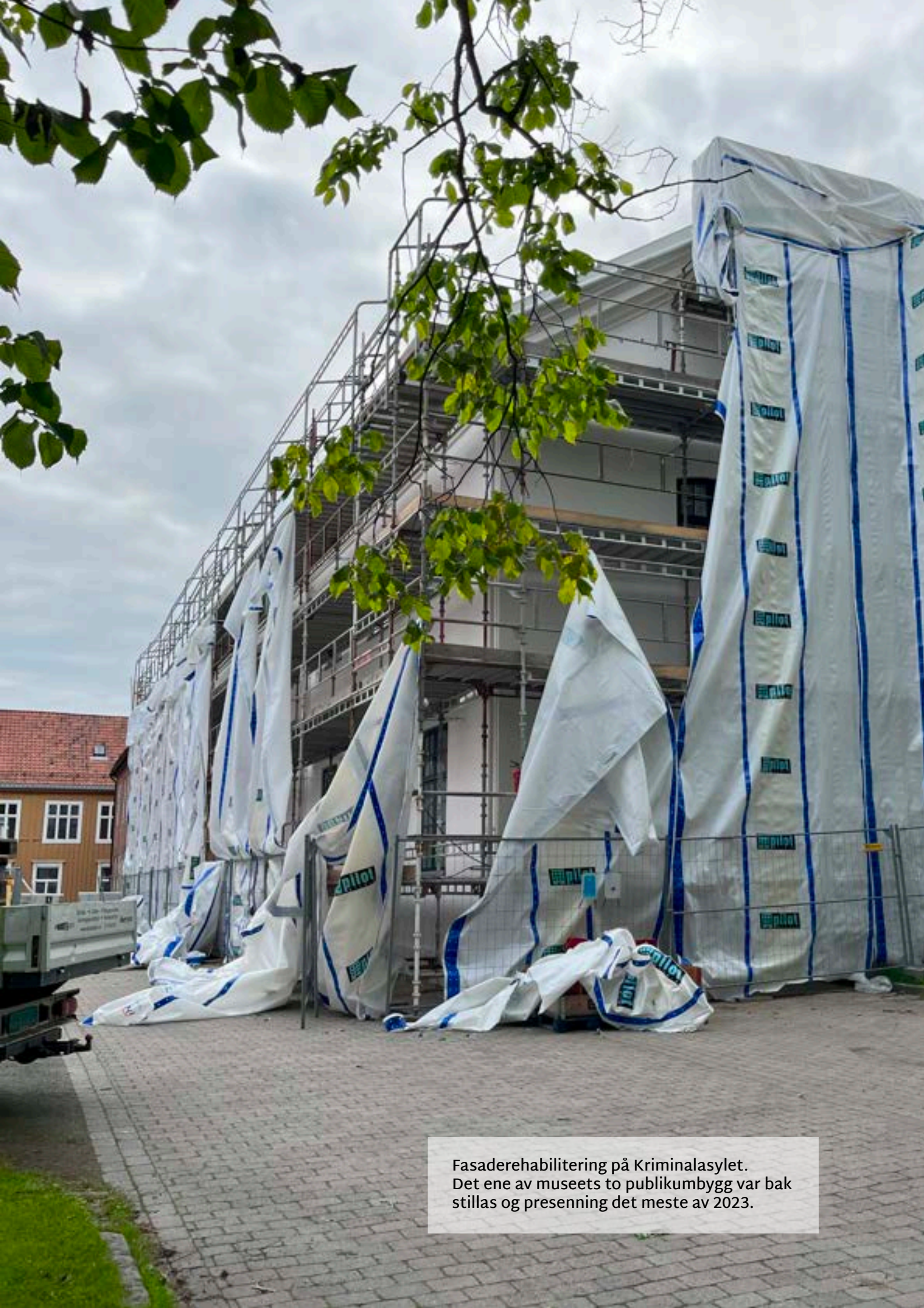
Fasaderehabilitering på Kriminalasylet. Det ene av museets to publikumbygg var bak stillas og presenning det meste av 2023.