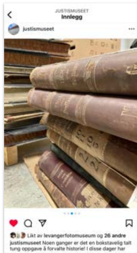
Museets «indre liv» i sosiale medier. Arkivmateriale klart for avlevering.

Måten de ulike sosiale medie-plattformene brukes endres stadig. Det gjør at brukertall fra år til år ikke nødvendigvis ikke gir det beste bildet av hvordan Justismuseet når ut. Men vi registrerer at på Facebook var det i 2023 en økning på nær 12% såkalt «content interactions» - noe som nok sier noe om at dette fortsatt er en relevant kanal for å nå publikum, om ikke alle målgrupper.