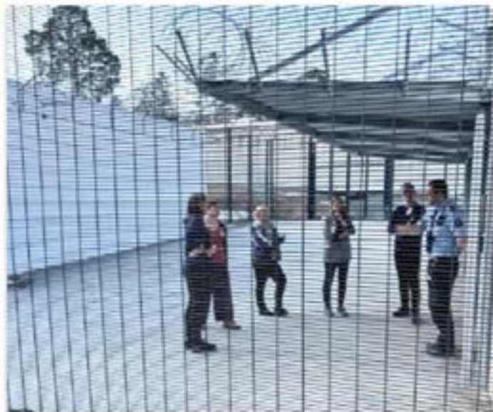
Fagdag i Trondheim fengsel

Høye krav til faglig grundighet preger Justismuseets arbeid. Som en liten kunnskaps-organisasjon med et bredt oppdrag er det både nødvendig og ønskelig å søke dialog og samarbeid med fagmiljøer og andre aktører utenfor museets fire vegger.