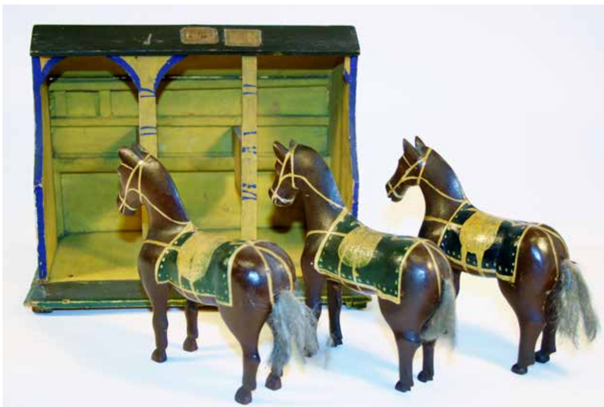
Fangearbeid fra Botsfengselet