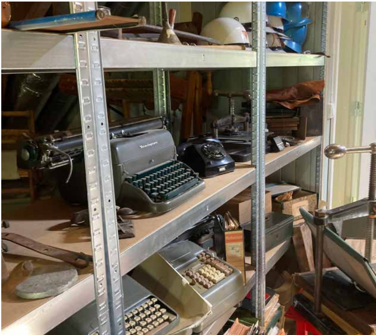
Den historiske samlingen ved Åna fengsel ble dokumentert og innlemmet i Justismuseets samling i 2022.

Justismuseet har mye straffehistorisk og fengselshistorisk materiale i sin samling. Noe er kommet via de nå nedlagte politimuseene i Oslo, Trondheim og Bergen, og noe er donert direkte fra ulike fengsler. Justismuseet mottok også et stort deponi fra daværende Region øst i 2015. Dette inkluderte de historiske samlingene etter Botfengselet, Bredtveit kvinnefengsel og Norsk fengselsmuseum i Kongsvinger. Nylig fikk Justismuseet dessuten det faglige ansvaret for dokumentasjon av den historiske samlingen etter Opstad tvangsarbeidshus, oppbevart i Åna fengsel på Jæren.