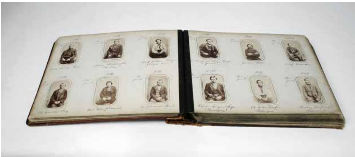
Forbryteralbum fra Kristiania ca. 1870

Eldre mennesker har en viktig rolle å spille når det gjelder overføring av immateriell kulturarv. Kanskje finnes det pensjonister i din region som kan bidra til sikring av etatens immaterielle historie? Det er ikke alltid at de selv er bevisste på at de sitter på minner og kunnskap som har verdi, og som kan gå tapt om de ikke dokumenteres.