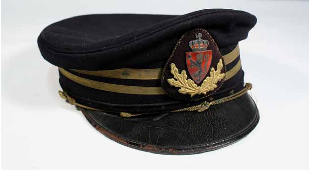
Uniformslue for fengselsvesenet 1905-1964