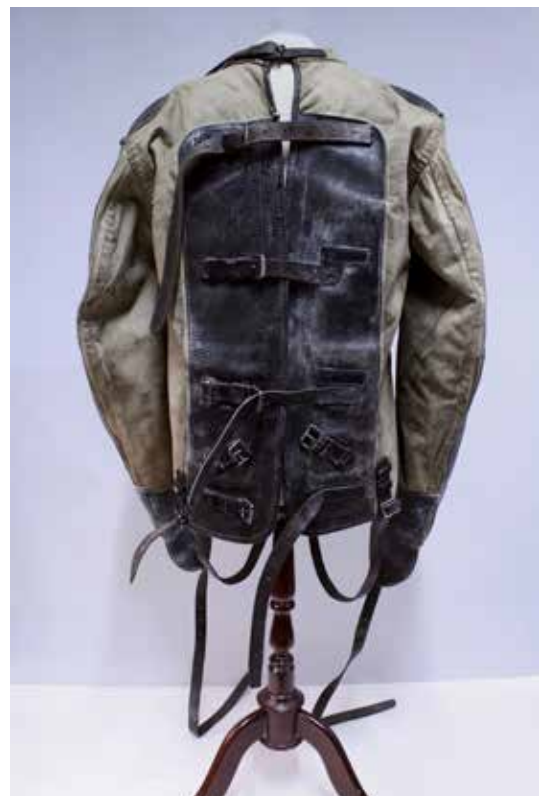
Tvangstrøye fra Kabelvåg hjelpefengsel