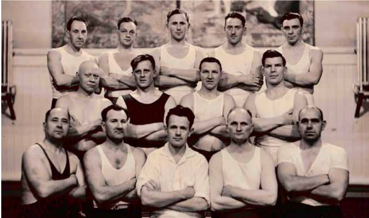
Fengselsbetjentenes idrettslag, Botsfengselet 1938

Minner, erfaringer og ferdigheter kan fortelle oss mye om fortiden. Dette kaller vi immateriell kulturarv. Denne kan dokumenteres og sikres for ettertiden gjennom skrift, lyd og film, eller overføres muntlig eller praktisk gjennom intervjuer, samtaler, kurs, seminarer osv. Det vanligste er historiske beretninger i form av artikler eller bøker.