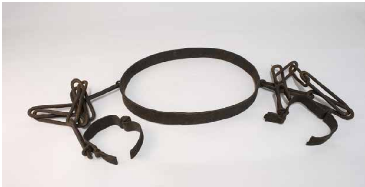
Ole Høilands fangejern ca. 1840

Symbolverdi og identitetsverdi - Betyr gjenstanden noe spesielt for visse grupper eller personer? Er gjenstanden knyttet til spesielle personer eller historiske hendelser? Historisk materiale kan f.eks brukes til å øke yrkesstolthet, fellesskapsfølelse og følelse av kontinuitet, særpreg og tilhørighet på en arbeidsplass. Mange bruker f.eks gamle foto som dekorelement i kontorlandskapet, i ankomsthallen eller på møterommet.