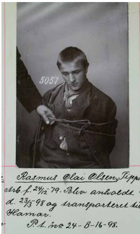
Forbryterportrett fra 1898

Besøk oss gjerne på våre hjemmesider www.justismuseet.no , Digitalt Museum, Facebook, Youtube og Instagram - eller kom innom oss i Kongens gt. 95 i Trondheim!