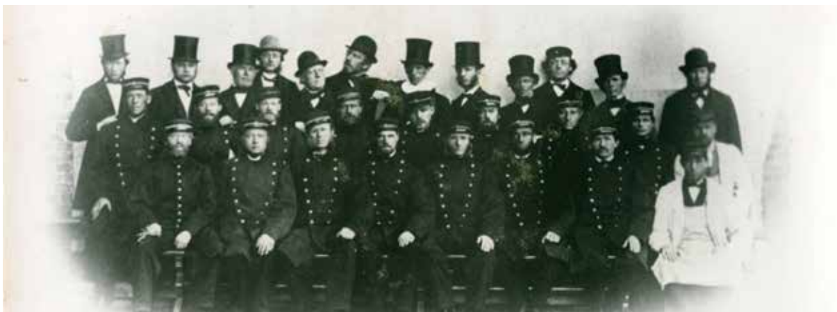
Ansatte ved Botsfengselet ca. 1860

Dersom historisk verdifullt materiale i offentlig eie skal avhendes til private, er det derfor viktig at eierskiftet dokumenteres godt, og at for eksempel foto og kvitteringer arkiveres, slik at materialets "livsløp" blir bevart. Hovedregelen bør være at man unngår avhending til private.