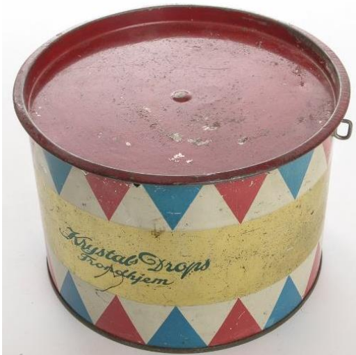
Dropsboks fra Dropsfabrikken

Da politiet kom, så de fotspor i snøen. Da skjønte de at det bare hadde vært en person i bygget. Men politiet fant aldri ut hvem som hadde gjort det.