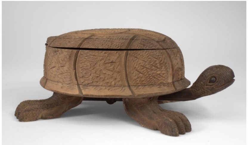
Skilpadde, Kriminalasylet (laget mellom 1895-1963)