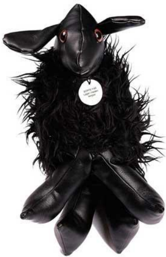
Sort får, Halden fengsel (2022)

Bakerst i rommet står lekedyr bak glass. Lekene er skåret ut av fanger som levde for over hundre år siden. Disse tingene hører til samlingen vår, og er ikke til salgs.