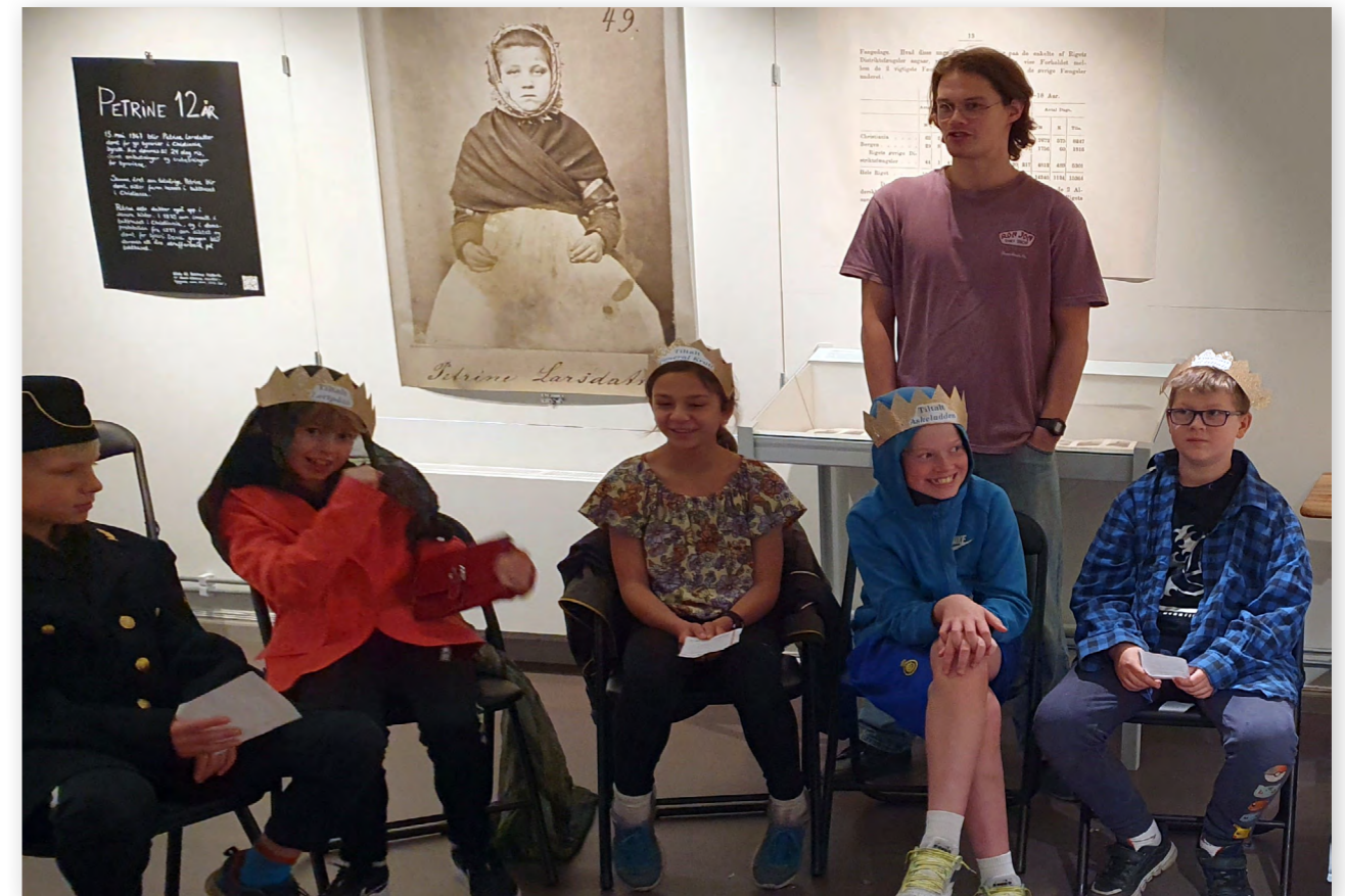
Klart for konfliktråd! 6. trinn med rollespill på museet.

Justismuseet en aktør i det norske demokratiet. Som det står i innledningen til stortingsmeldinga om museum fra 2021: «I eit samfunn der polariseringa tykkjast aukande og den offentlege debatten hardnar, trengst arenaer som har publikum sin tillit til å kunna nyansera og perspektivera, forankra i kunnskap, slik musea i dag har.» (Meld. St. 23 (2020–2021)). Hele Justismuseets virksomhet, fra systematisk samlingsarbeid og kunnskapsutvikling til variert formidling, bidrar til at nye grupper og generasjoner får mulighet til å bli kjent med, og utvikle, det kollektive prosjektet som den demokratiske rettsstaten er.